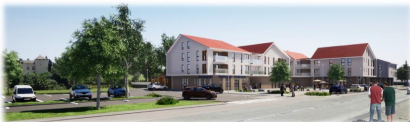
Schémas illustratifs (non opposables)